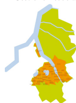
Servizi Sociali d'Ambito Distretto di Lecco