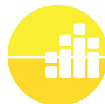
sineresi società cooperativa sociale