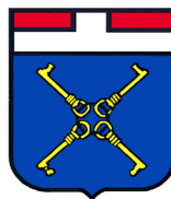
COMUNITA' MONTANA VALSASSINA, VALVARRONE, VAL D'ESINO E RIVIERA